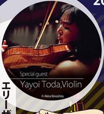
Special guest Yayoi Toda, Violin